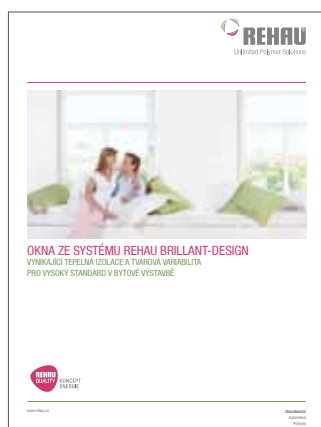
Prospekt okenních systémů Brillant-Design Tiskové číslo 799700CZ

Již více jak půl století firma REHAU ve světě vyvíjí a vyrábí profilové systémy pro okna, dveře a fasády, a to s inovativním myšlením propojeným s praxí a s tradičně vysokými požadavky na kvalitu. Proto využívají technici firmy REHAU také hodnotné poznatky z oblasti technického zařízení budov a inženýrských staveb, ve kterých je firma REHAU celosvětově rovněž mnoho let úspěšně činná. Tyto synergie, těsné partnerství s výrobci stavebních materiálů a průběžné proškolení pracovníků autorizovaných firem řadí skupinu REHAU k vedoucím výrobcům oken, dveří a fasád v České republice.